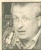
Veit Heinichen Schriftsteller